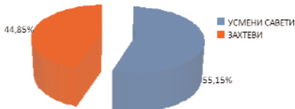
Графикон бр. 1

Од укупно 332 захтева решено је 289 захтева док се по основу 43 захтева још увек води поступак.